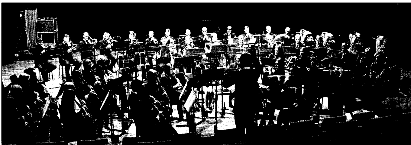
□ Májovák Karviná

V letošním roce se konal 18. ročník nejvýznamnější soutěže v oblasti dechové hudby - World Music Contest v nizozemském Kerkrade. Tato soutěž se koná ve čtyřletém intervalu, probíhá celý měsíc červenec, a odborníky i laickou veřej-