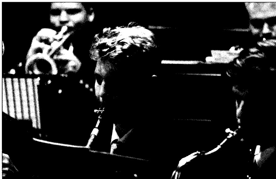
□ Soustředění všech muzikantů bylo obrovské

Májovák podal na soutěži vynikající výkon a po zásluze byl odměněn umístěním ve zlatém pásnu s celkovým ziskem