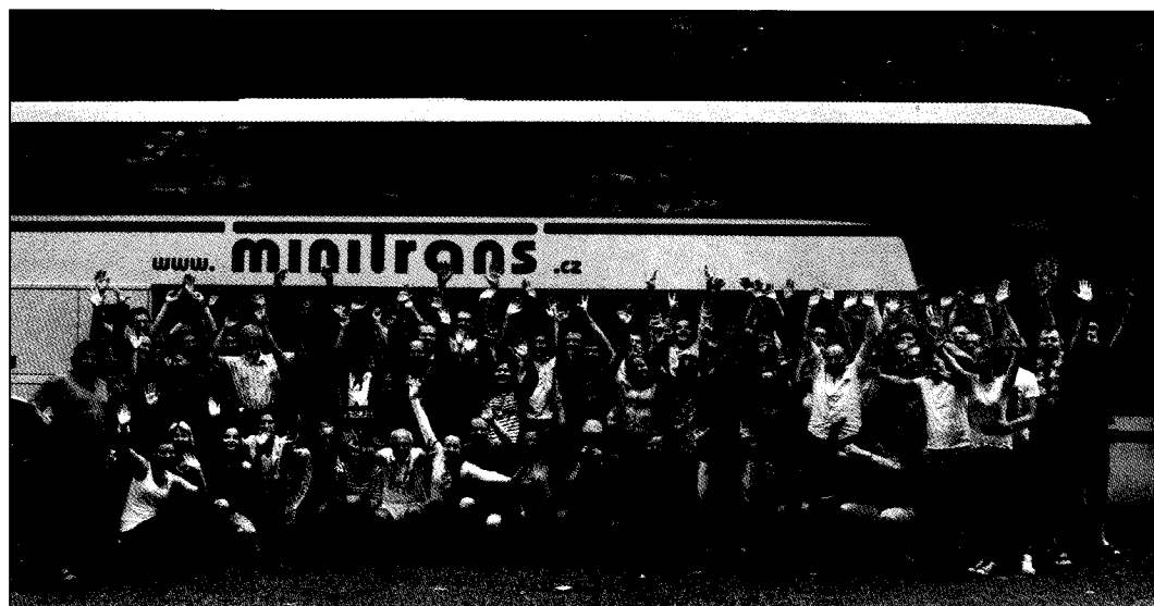
□ Poslední zamávání a pak už jen dlouhá cesta domů

gent orchestru Ondřej Packan. Ve svých 25 letech patřil na WMC mezi nejmladší dirigenti a mezi svými, vesměs o generaci staršími kolegy, podal skvělý výkon, což je dalším příslibem do budoucna.