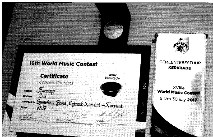
□ Diplom a zlatá medaile pro Májovák

83,17 bodů. Zásahu na tomto úspěchu českého zástupce na této soutěži mají jednak všichni členové orchestru díky své poutivé přípravě na akci, ale také šéfdiri-